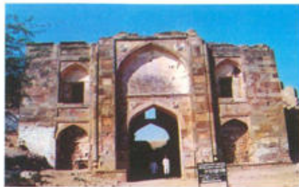
तारागढ़ दुर्ग का प्रवेश-द्वार