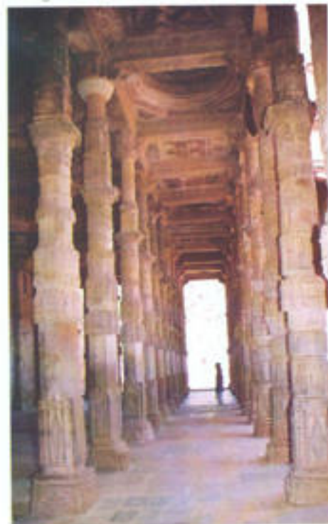
अधर-दिन-का झोंपड़ा का आंतरिक दृश्य Interior view of Adhai-Din-Ka-Jhonpura