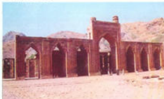
अड़ाई-दिन का झोंपड़ा

अड़ाई-दिन का झोंपड़ा : कुतुबुद्दीन ऐबक द्वारा लगभग १२०० ई० में निर्मित यह मस्जिद अड़ाई-दिन-का झोंपड़ा के नाम से जानी जाती है। ऐसा विश्वास है कि इस स्थान पर अड़ाई दिन चलने वाले उर्स के कारण इस मस्जिद का नाम अड़ाई-दिन-का झोंपड़ा पड़ा। मस्जिद के बरामदे सुन्दर अलंकृत स्तम्भों से युक्त हैं। प्रार्थना कक्ष के ऊपर छत को सहारा देते तीन पंक्तियों में स्तम्भों का सुन्दर संयोजन मिलता है। सामने ऊँचे कोणारकर मेहराब बने हैं जिन पर बारीक अलंकरण है। लगभग युक्त कक्ष को नी-अष्टकोणीय भागों में बाँटा गया है जिसके ऊपर माध्य मेहराब के दोनों पार्श्व में दो छोटी मीनार बनी हैं। मध्य मेहराब पर कृषिक एवं तुंगरा लिपि के उत्कीर्ण लेख इस स्मारक को भव्यता प्रदान करते हैं।